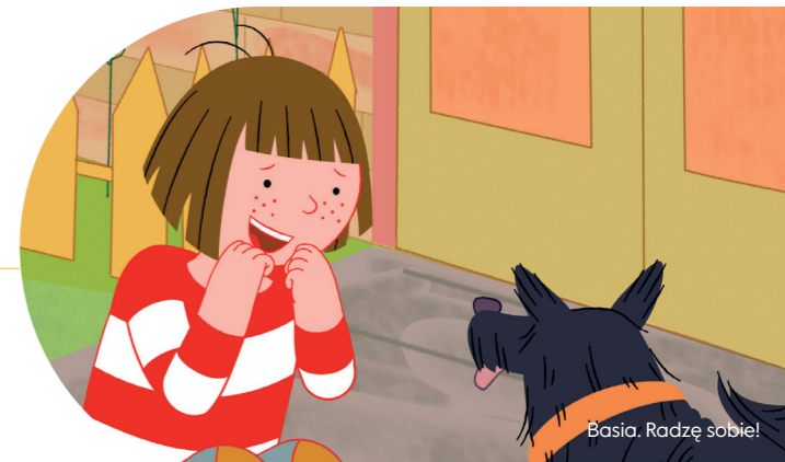
Basia. Radzę sobie!

pojęcia kluczowe: urodziny, przyjaciele, rodzina, rodzeństwo, przygoda