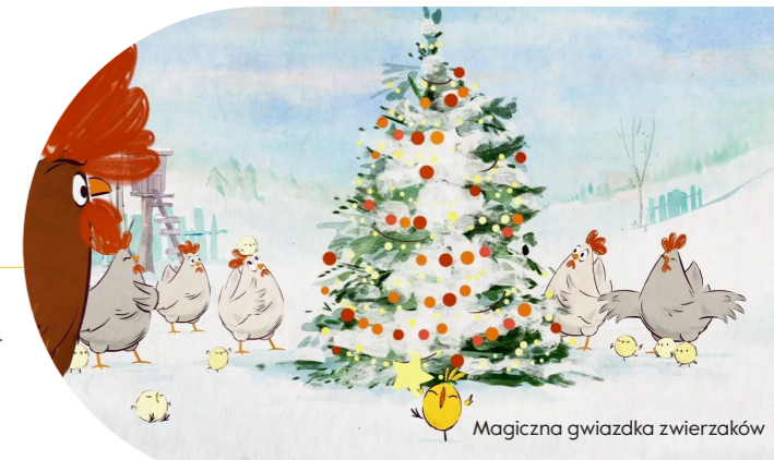
Magiczna gwiazdka zwierzaków

pojęcia kluczowe: podróż, nowe miejsca, przygotowania do podróży, bezpieczeństwo w podróży