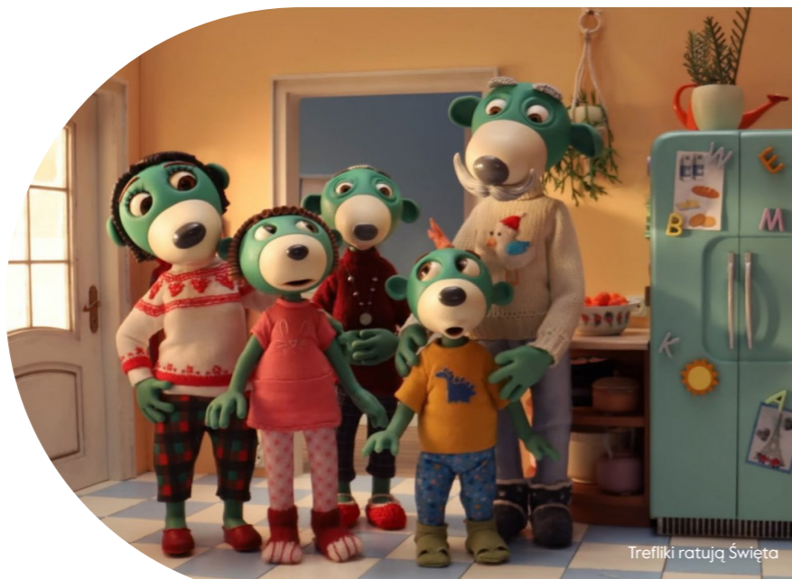
Trefliki ratują Święta

nauczycielka edukacji przedszkolnej i wczesnoszkolnej, edukatorka, wicedyrektorka w Przedszkolu Akademia Kreatywności w Kielcach.