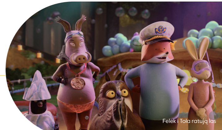
Felek i Tola ratują las

pojęcia kluczowe: złość, agresja, wyrażanie złych emocji, uważność