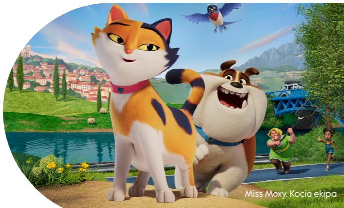
Miss Moxy. Kocia ekipa