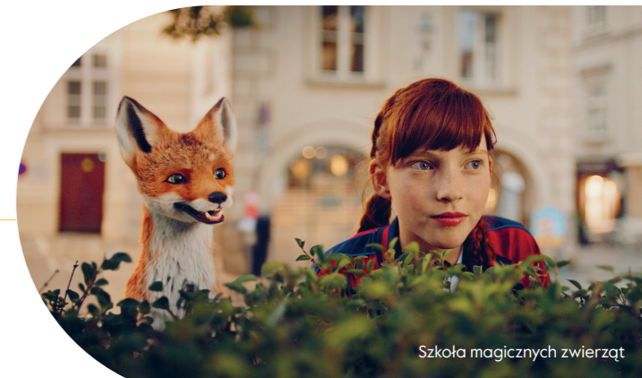
Szkola magicznych zwierząt

scenariusz lekcji: Podróż śladami dzikiego mustanga.