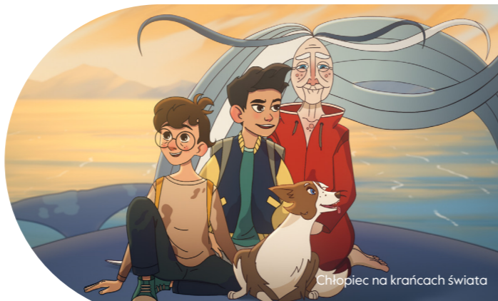
Chłopiec na krańcach świata